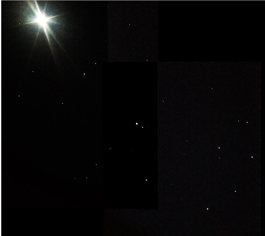
(le 4/04/2020 ; photo iPhone)